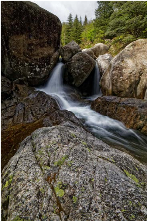
Y. MANCHE - PNC