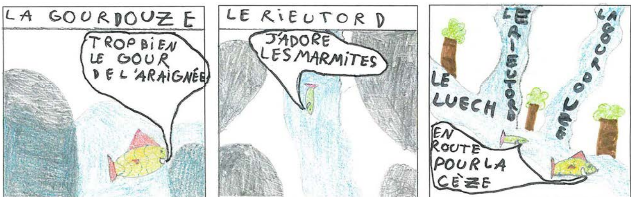
Elèves de l'école de Vialas pour le programme Graines de Rivières Sauvages