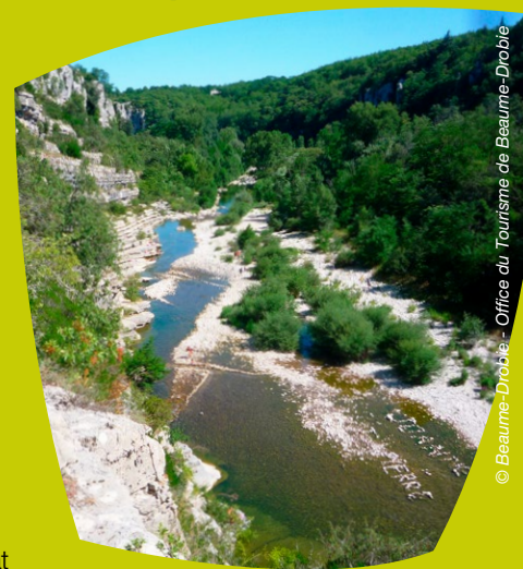
© Beaume-Drobie - Office du Tourisme de Beaume-Drobie